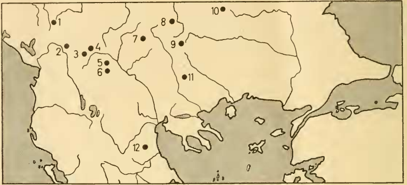
Abb. 1: Die Fundorte von Bombus lapponicus F. auf der südlichen Balkan-Halbinsel: 1 Tschakor-Paß (Jugoslawien); 2 Paschtrik (Albanien); 3—6 Titov-Vrh, Kobeliza, Pepelak und Begova (Jugoslawien); 7—11 Ossogowska-, Witoscha-, Rila-, Balkan-Planina und Alibotusch (Bulgarien); 12 Olymp (Griechenland).

2800 m Höhe je 1 ♀. Dies ist das bisher südlichste Vorkommen der Art in Europa (40° n. Br., in Italien 42° n. Br.).